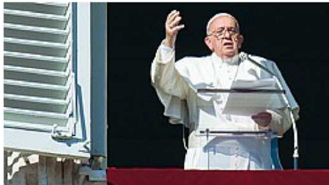
Papa Francesco durante l'Angelus domenicale di ieri

Le religioni possono e debbono fare molto per la pace formando e educando