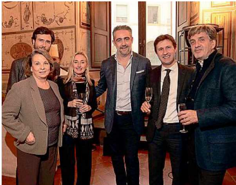
Brindisi e applausi ieri mattina a Palazzo Vecchio